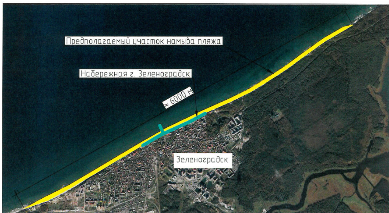
СХЕМА границ территории, в отношении к которой осуществляется подготовка документации по планировке территории

ПРИЛОЖЕНИЕ к приказу Агентства по архитектуре, градостроению и перспективному развитию Калининградской области от « 09 » декабря 2019 г. № 457